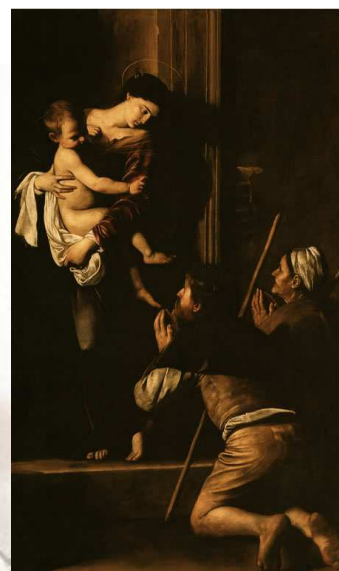
Madona (baroko – hra světla a stínu)

(oproti přirozené renesanci a rozevlátému a dynamickému baroku jsou gotické postavy strnulejší)