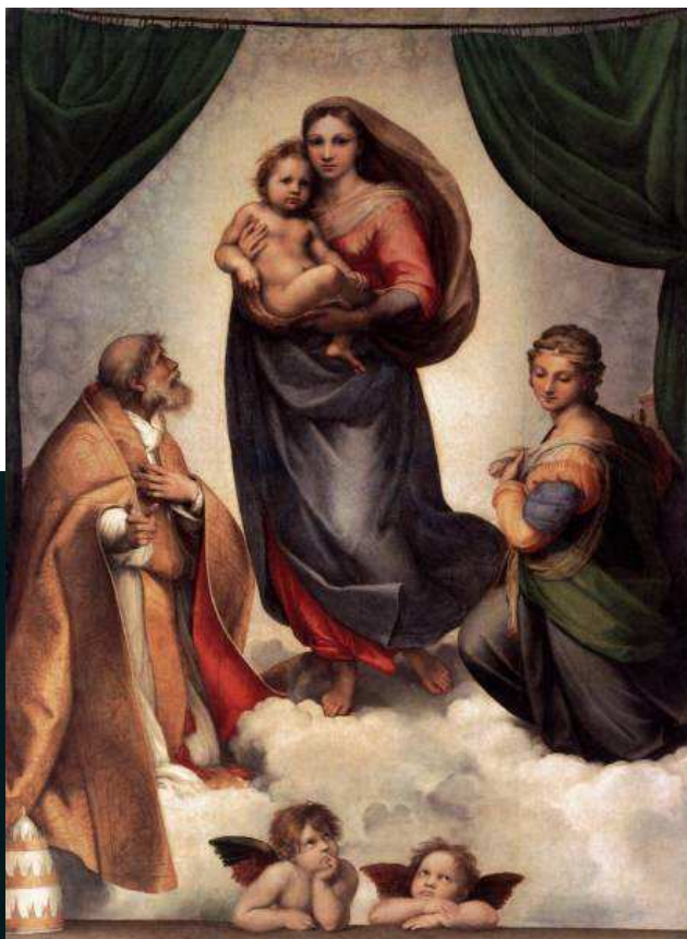
Raffael, Sixtinská Madona (renesance)

(pieta - Marie s Ježíšem sňatým z kříže)